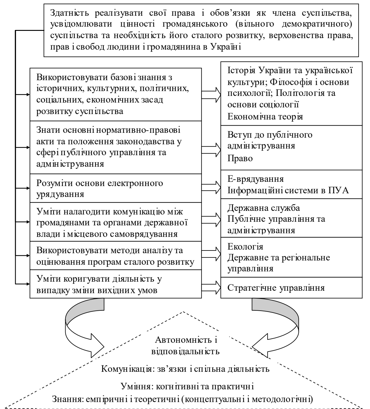
Рис.1. Мультидисциплінарні зв'язки щодо формування громадянських компетентностей

вирізняється підвищеною особистісною активністю, новими принципами взаємодії в умовах сучасних соціокультурних трансформацій [3, с.23].