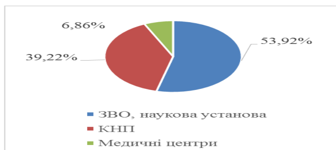
Рис. 1 Розподіл закладів та організацій, представники яких прийняли участь в опитуванні

За результатами анкетування встановлено, що лівова частина респондентів має досвід проведення клінічних досліджень і потребує знань з менеджменту та практичних навичок з планування, організації та координації таких досліджень (рис. 2). Так, майже 75 % опитаних вказали на необхідність отримання додаткових знань з основ сучасного менеджменту, які не тільки нададуть можливість більш якісно проводити клінічні дослідження, але і допоможуть збільшити кількість успішних дослідницьких проектів.